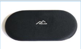
D 24100 2 Gel Klebeplaster, oval (100 x 200 mm)