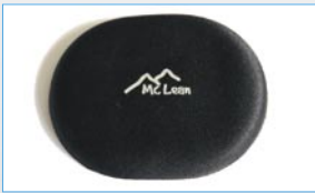
D 24100 1 Gel Klebeplaster, oval (80 x 100 mm)

Auf Anfrage sind weitere Produkte lieferbar.