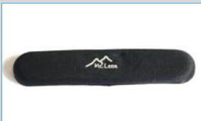
D 24200 1 Gel Klebeplaster, flach (40 x 190 mm)