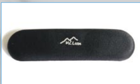
D 24200 2 Gel Klebeplaster, flach (50 x 190 mm)